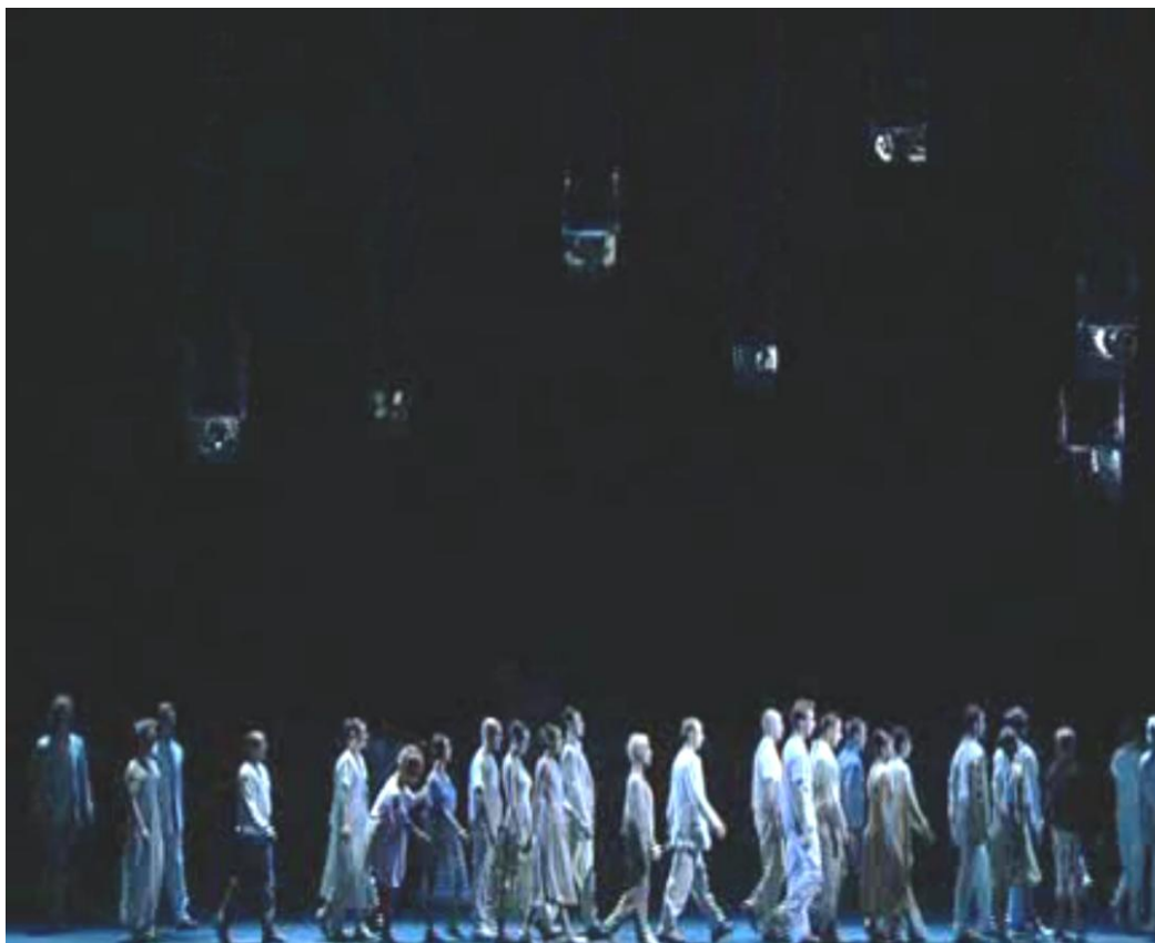
Figura 1. Cena de Outis , de Berio. A utilização do vídeo pulveriza imagens fragmentárias do que é visto no palco, atuando de maneira similar ao que ocorre entre intérpretes musicais e alto-falantes com a amplificação sonora no espaço da performance.

Existem experiências teatrais com instrumentos ou vozes que podem encontrar seu centro e coerência expressiva em duas direções alternativas – em operações que eu gostaria de definir como aditivas ou subtrativas. No primeiro caso, cada participante é envolvido em um número exorbitante de funções musicais e relações que, organicamente consubstanciadas, encontram sua justificativa e refúgio no gesto, em uma espécie de “palavra cênica” – parola scenica – da escuta. No segundo caso, a obra musical se resume a poucos detalhes da performance que, isolados desta maneira, tendem a tornar-se autônomos (respirar de distintas maneiras mas sem produzir sons, por exemplo) – uma situação que beira perigosamente o anedótico, a paródia fácil e o kitsch . (BERIO, 2006, p.116).