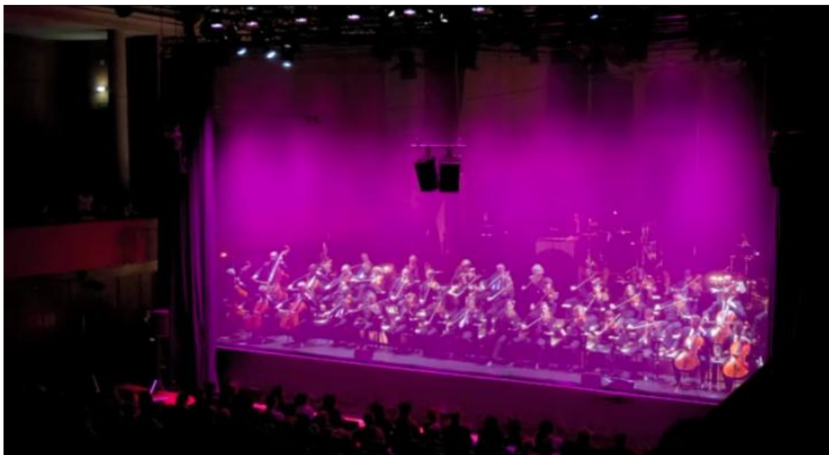
Figura 3. Performance de Trans , de Stockhausen. A metáfora da cortina é transmutada aos sons pelo cluster realizado pelas cordas.

A obra começa com o desvelar gradual de um cluster nas cordas, do registro agudo até um cluster em ampla banda espectral que preenche toda a extensão do corpo instrumental. Este som persiste quase inalterado durante toda a obra (...). Em certo sentido, este objeto sonoro composto pode ser considerado como uma metáfora auditiva para uma ‘cortina’. No tocante à escuta, o efeito é realçado pelo fato de que os materiais melódicos executados pelos instrumentos de sopro são ouvidos ‘através’ (...) desta barreira sonora e a desconexão desejada com a apreensão orquestral típica sustenta-se pelo uso de sons de tear pré-gravados que perpassam o espaço acústico. (WISHART, 1996, p. 133).